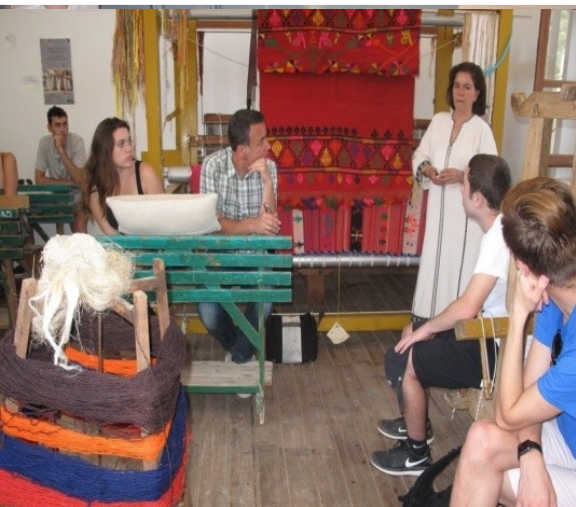
Educating students of Boston College USA