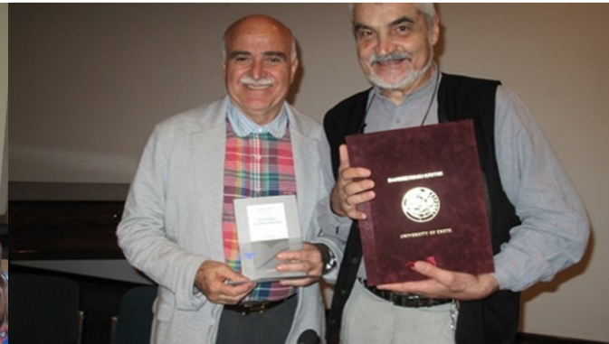
Prof. Serge Latouche