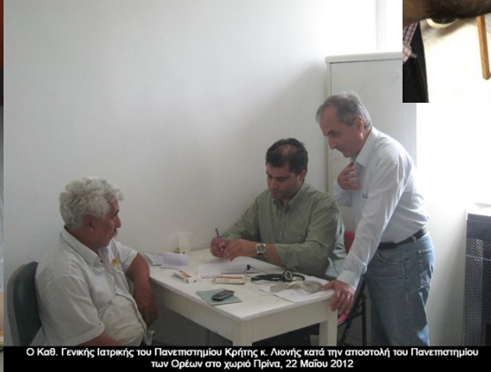
Ο Καθ. Γενικής Ιατρικής του Πανεπιστημίου Κρήτης Κ. Λιονής κατά την αποστολή του Πανεπιστημίου των Ορέων στο χωριό Πρίνα, 22 Μαΐου 2012