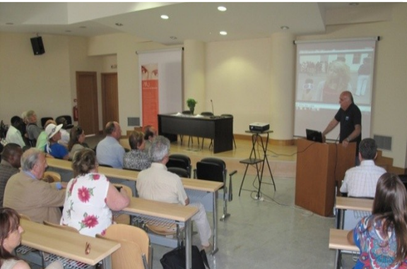
Presenting UoM at international conferences