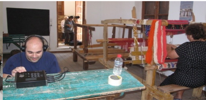
Recording sounds of the loom, Bournemouth Univ.