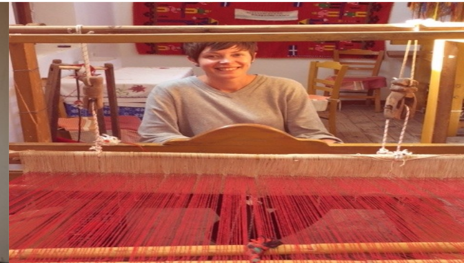
Educating students from Germany