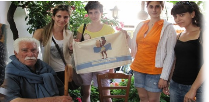
Educating students from Greek Universities