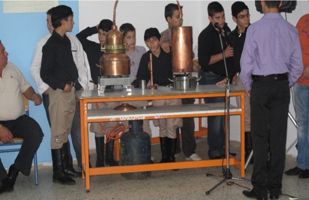
Αλληλοδασκαλία μαθητών Πόλεων και Περιφέρειας, παρουσία των Πρυτάνων της χώρας