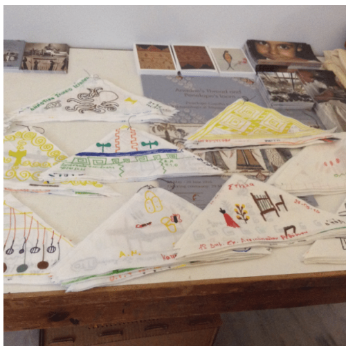
Ζωγραφιές των παιδιών που παρακολούθησαν την έκθεση και εμπνεύστηκαν με μοναδική φαντασία και δημιουργικότητα

Αρκεί να παρατηρήσει κανείς προσεκτικά τον αργαλειό που ανακατασκευάστηκε με τους αγνώθες, τα βάρη που τέντωναν τα στημόνια. Η κίνηση των χεριών προς τα πάνω που απαιτεί για να λειτουργήσει, ήταν σχεδόν δοξαστική, σαν επίκληση σε κάτι το θεϊκό. Και είναι αυτό ένα έκθεμα που εντυπωσιάζει, κυρίως τα παιδιά (150 σχολεία έχουν ήδη επισκεφθεί την έκθεση) που στέκονται με έκπληξη. «Λειτουργεί με υπολογιστή;» ή «είναι ρομπότ;» αναρωτιούνται κάποια, ενώ άλλα προσεγγίζουν εξοικειωμένα τον αργαλειό που λειτουργεί συνεχώς, από τις 9 το πρωί ως τις 8 το βράδυ δίπλα. Σε πολλά σπίτια υπάρχουν στην Κρήτη αργαλειοί, γιαγιάδες υφάινουν, είναι μια εικόνα γνώριμη για τα παιδιά.