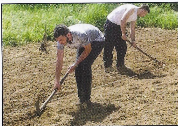
Σπορά Λιναριού - Αίμονα Ρεθύμνης