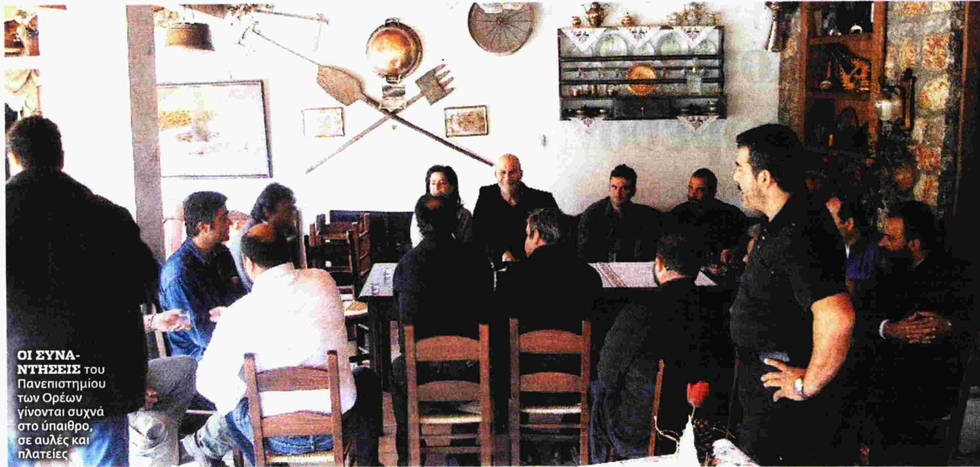
ΟΙ ΣΥΝΑΝΤΗΣΕΙΣ του Πανεπιστημίου των Ορέων γίνονται συχνά στο ύπαιθρο, σε αυλές και πλατείες

Καθηγητές του Πανεπιστημίου Κρήτης βοηθούν κατοίκους ορεινών χωριών να διατηρήσουν παλιές τεχνικές