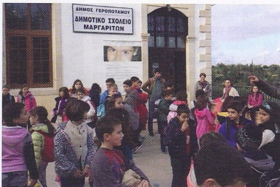
Αλληλοδιδασκαλία Μαργαρίτες Ρεθύμνης Παγκόσμια Ημέρα Βουνών 2015

νημάτων αλλά και να βάψουν νήματα με φυτικές βαφές. Μία διαδικασία άγνωστη στα παιδιά του σήμερα αλλά τόσο διαδεδομένη στην Κρήτη του χθες μια και στο νησί ύφαιναν χιλιάδες χρόνια πριν, στη Μινωική Εποχή, αριστουργήματα, με σύμβολα ιστορικού, θρησκευτικού και κοινωνικού περιεχομένου. Το Πανεπιστήμιο των Ορέων και η Αποστολή Πηνελόπη Gandhi επαναπροσδιορίζουν τον τρόπο διάδοσης και αναβίωσης μιας ξεχασμένης τέχνης που ανήκει στο ευρύτερο σύνολο των δραστηριοτήτων των ανθρώπων των Ορέων και ενεργοποιεί το ανθρώπινο δυναμικό, για να αντισταθεί στο μιμητισμό και στην παγκοσμιοποίηση που η κοινωνία του γρήγορου, του ετοιμοτου και του ευτελούς επιτάσσει.