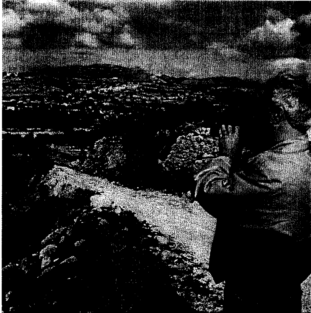
Ιεράπετρας Α.Ε., καθώς και εκείνοι που θα εγγραφούν τις επόμενες ημέρες καλούνται να ει- λάμερίδα, που αντιστοιχεί σε 500 τετραγωνικά μέτρα οικοπέδου.

να από τη διοίκηση της ΒΙ.ΠΑ. Ιεράπετρας Α.Ε. του κεφαλαίου