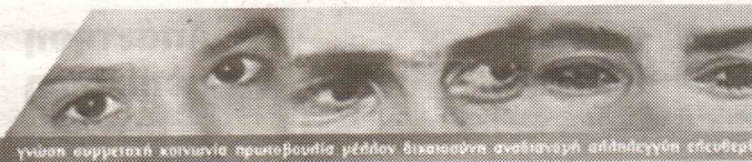
Πανεπιστήμιο των Ορέων