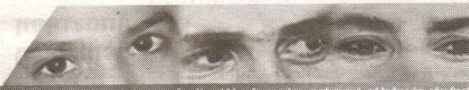
Πανεπιστήμιο των Ορέων